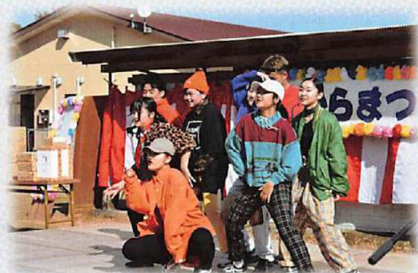
(出物「ヒップホップダンス」ご出演)