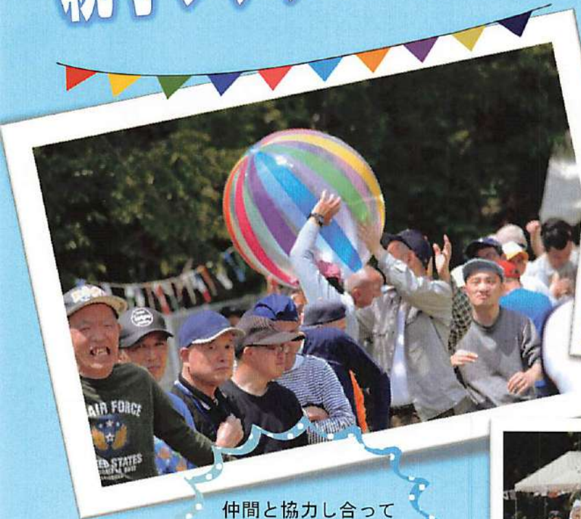
仲間と協力し合っ て見せるぞ、団結力！