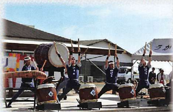
(出物「和太鼓・雷龍太鼓」さまご出演)

皆さまこのイベントに向け一生懸命に準備を重ね、当日はとても楽しいひと時を過ごします。