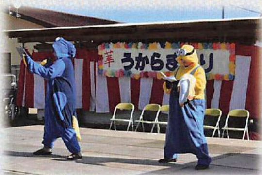
(平成30年テーマ「華～あなたがナンバーワン」)

ビッグイベントの一つとして、うからの里では「文化祭」の位置付けで行われるお祭りです。外部より屋台や物販の業者を招き、利用者の皆さま、地域の方々と一緒に楽しい時間を過ごします。晴天時はうからの里グラウンドにて、雨天時はうからの里館内にて舞台を設置し、練習してきた演目を各班が披露します。又、外部から招いた歌、踊り等を披露する団体さまの出演する出物も見ものとなっています。