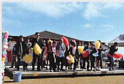
(ななくさ班「仮装・ダンス」)