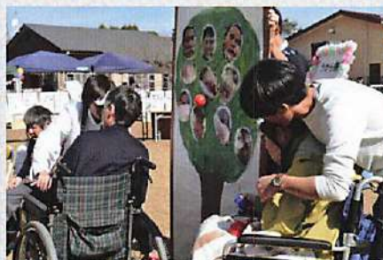
(のぞみ班「みんなの笑顔ツリー」)