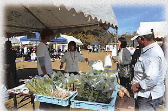
(はにわ班の作った野菜類、陶芸品の販売)