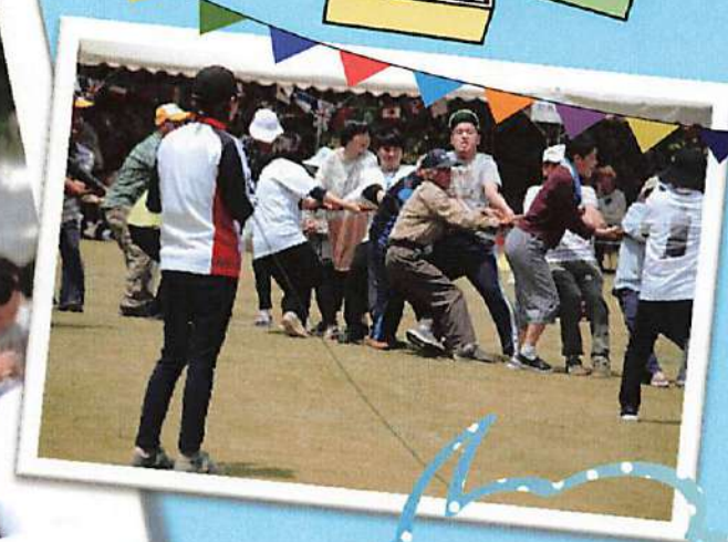
ご利用者と一緒に、ご家 族も必死です！ 負けるものかあ～～。