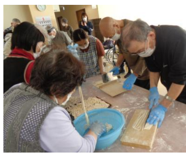
がんばれ！がんばれ！