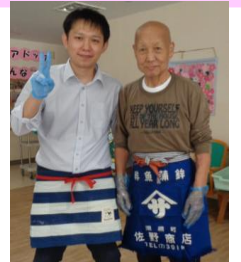
ケアハウスの前かけ男子♡