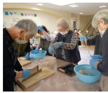
切った麺をほぐします…限りなく…限りなく！