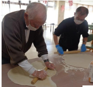
生地をのぼします えっほ♪えっほ♪