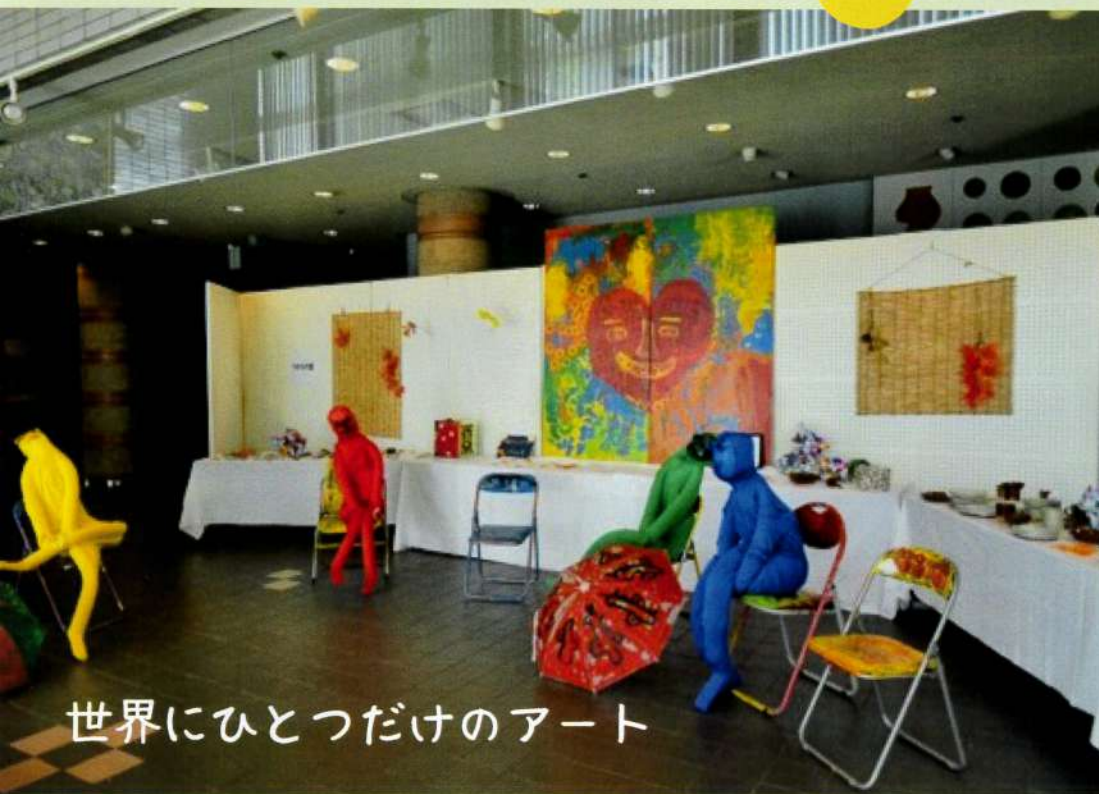
世界にひとつだけのアート