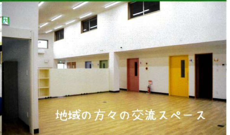
地域の方々の交流スペース