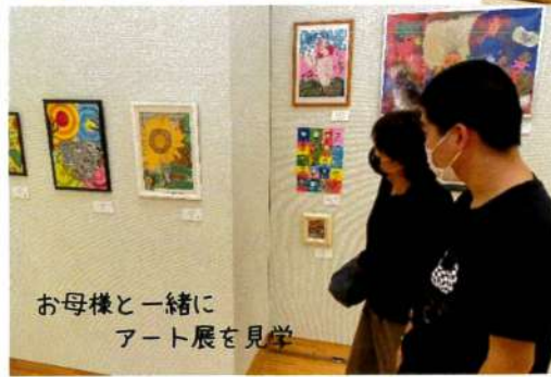
お母様と一緒に アート展を見学