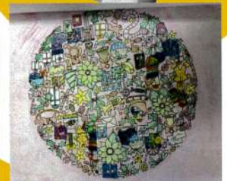
←どちらとも色塗りされて、とても綺麗です。

←こちらの不死鳥は、「アートで被災地の応援」を目的に、どんな困難にあっても何度でも蘇る伝説の鳥「不死鳥(フェニックス)」のデザインを全国の障がいのある方とない方で合作し、被災地に届けるプロジェクトとして参加されました。宮崎では、アミュプラザみやざき屋上テラスに展示されました。