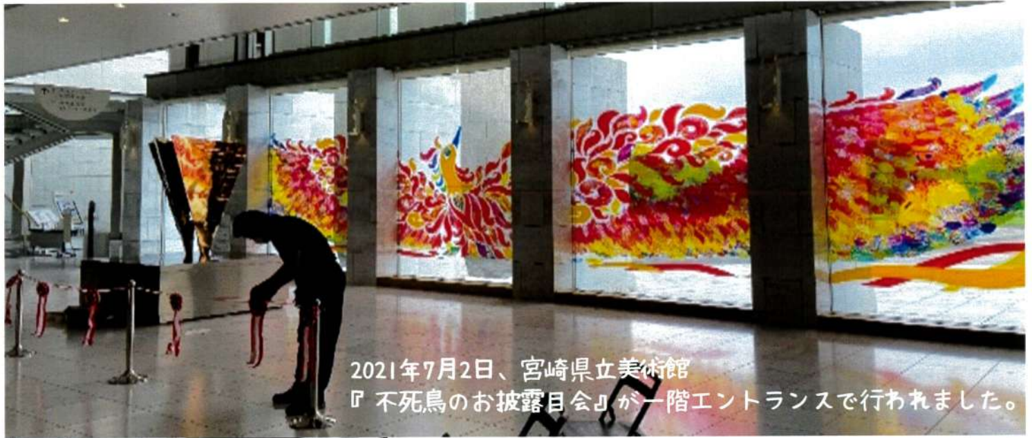
2021年7月2日、宮崎県立美術館 『不死鳥のお披露目会』が一階エントランスで行われました。