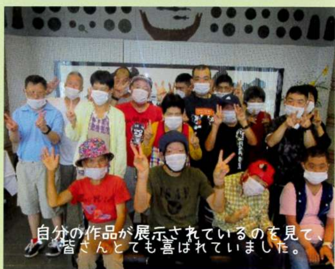
自分の作品が展示されているのを見て、皆さんとても喜ばれていました。

ご利用者個人で作られた作品から、共同制作で個性が合わさった作品など数多くが展示され、独特な雰囲気を感じられる空間になっていました。