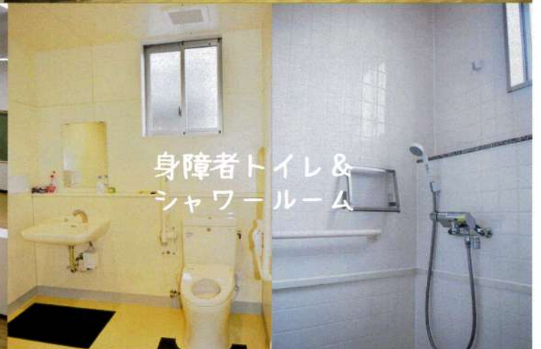
身障者トイレ & シャワールーム