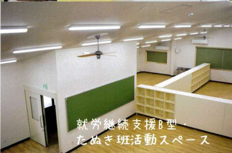
就労継続支援B型 たぬき班活動スペース